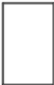
Schéma d'une plateforme